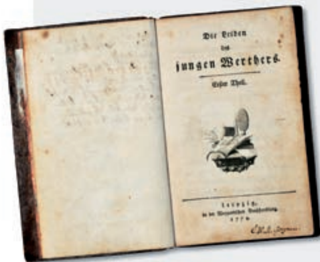
Die Erstausgabe von Goethes Werther : Sie erschien im Herbst 1774 zur Leipziger Buchmesse und wurde gleich zum Bestseller. 1787 überarbeitete Goethe den Roman, wobei unter anderem das Genitiv-s im Titel entfiel.

Hätte nicht auch Goethes Leiden des jungen Werther verboten werden müssen, wenn man die Maßstäbe anlegt, die die Richterinnen und Richter des Bundesverfassungsgerichts 2008 in der Esra -Entscheidung setzen? Das jedenfalls meinten die dissentierenden Richter in ihren Sondervoten. Immerhin sei schon bei damaligem Erscheinen dieses Briefromans in der Romanfigur Lotte Charlotte Buff erkannt worden, in die sich Goethe, den man in der Figur des Werther zu entdecken glaubte, während seiner Wetzlarer Referendarzeit verliebt hatte. Charlotte Buff war ebenso wie die Romanfigur Lotte zur Zeit ihrer Begegnung mit Goethe schon verlobt und dann verheiratet. Ihr Ehemann Johann Christian Kestner, der sich in der Romanfigur Albert, dem Verlobten und späte-