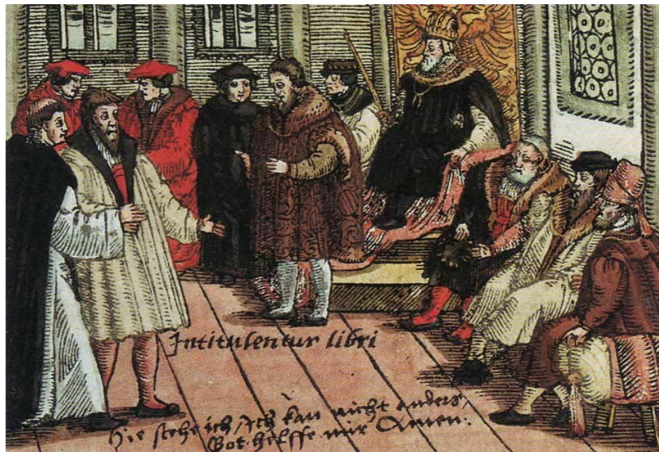
Luther auf dem Reichstag in Worms (kolorierter Holzschnitt, 1556)

Sie ist nun unter https://vimeo.com/548453756 abrufbar.