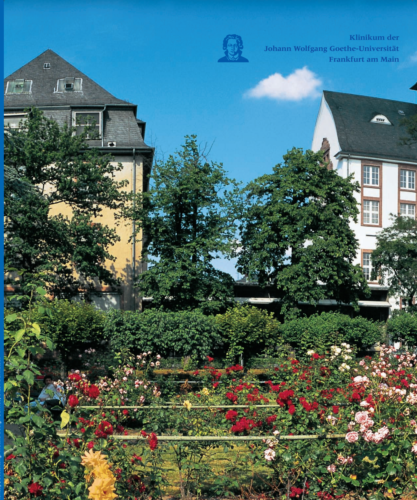
Konzept/Gestaltung: Wuttke Design Service, 64291 Darmstadt

Achtung Baumaßnahmen: Die landesweit größte Krankenhausbaumaßnahme von 2000-2009 ist in vollem Gang. Der Klinikumsbetrieb ist nicht beeinträchtigt, trotzdem bitten wir um Verständnis für eventuelle Unannehmlichkeiten (Umleitungen, Einschränkung der Parkflächen etc.).